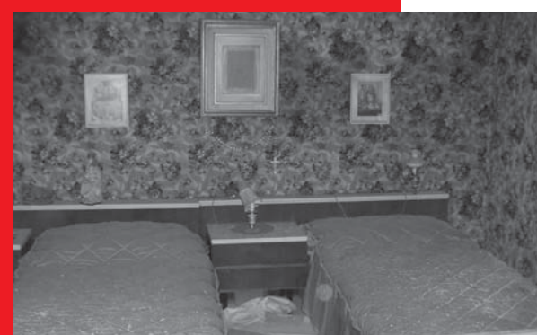
Die grosse Erbschaft / La grande eredità

entrata: Fr. 10.- | 8.- | 6.- www.cicibi.ch www.luganocinema93.ch www.cinemendrisiotto.ch www.cclocarno.ch