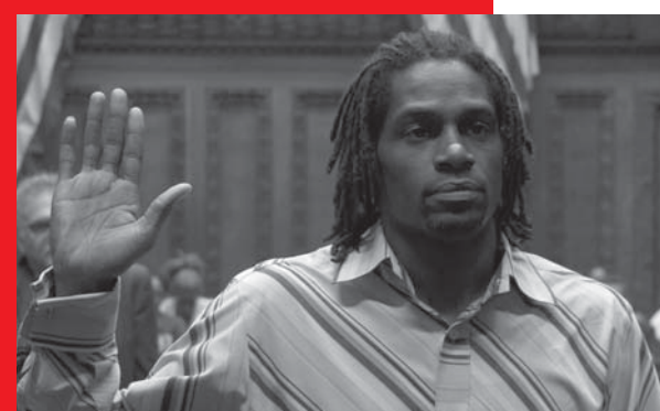
Cleveland contre Wall Street

Zimmer 202 – Peter Bichsel in Paris Eric Bergkraut