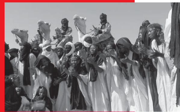
Toumast - entre guitare et kalashnikov

Satte Farben vor Schwarz Sophie Heldman Presenta Roberto Malacrida, medico, direttore dell'Istituto Medical Humanities dell'EOC