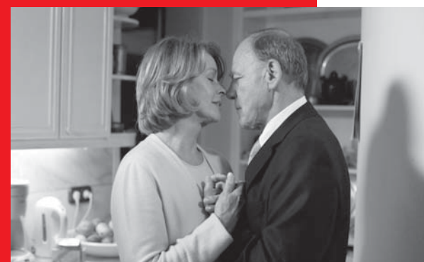
Satte Farben vor Schwarz